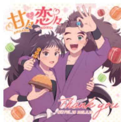
B6正方形ペーパー（ノベルティ）