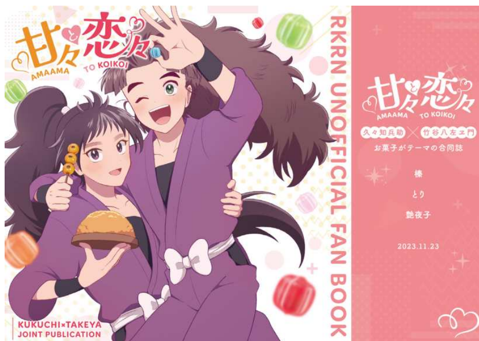
合同誌表紙イラスト・デザイン制作