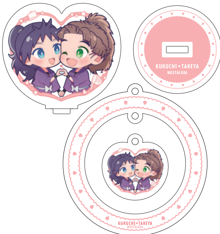
アクリルスタンド・キーホルダー イラスト・デザイン制作